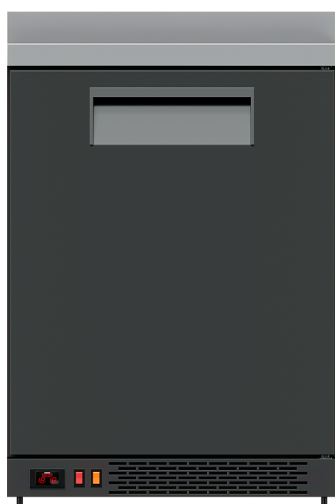
Стол барный ТМ101 (гладкая дверь и столешница с бортом)

Рекомендованная розничная цена: 80 113 рублей с НДС