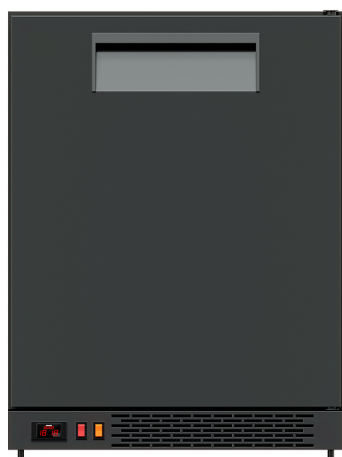
Стал барный TM101/гладкая дверь без стол-цы

Рекомендованная розничная цена: 73 403 рублей с НДС